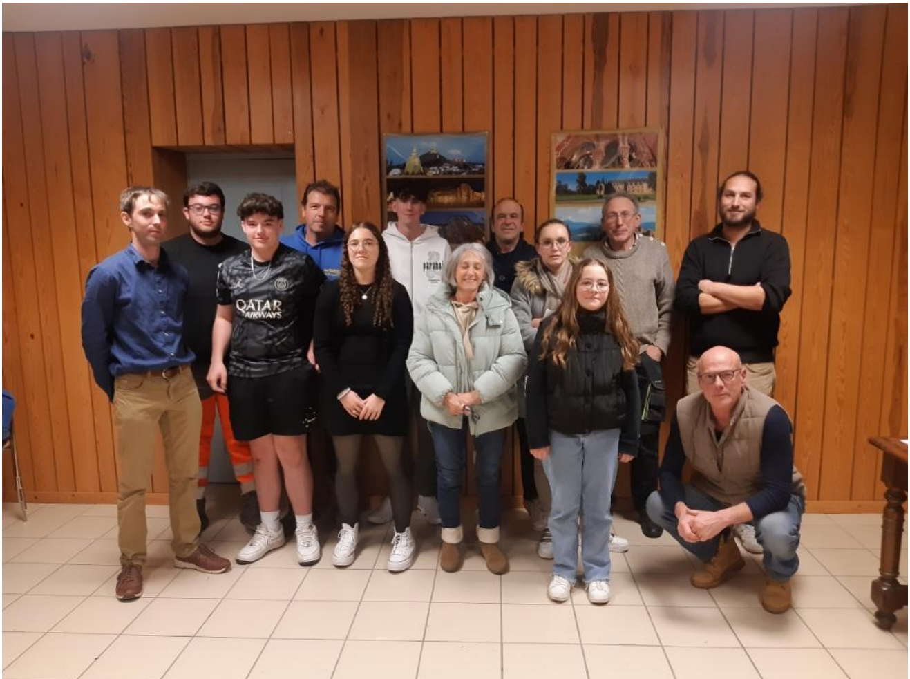
Photo du bureau et de quelques adhérents.

Après une première Fête du four réussie au mois de juin, nous leur souhaitons succès et longévité.