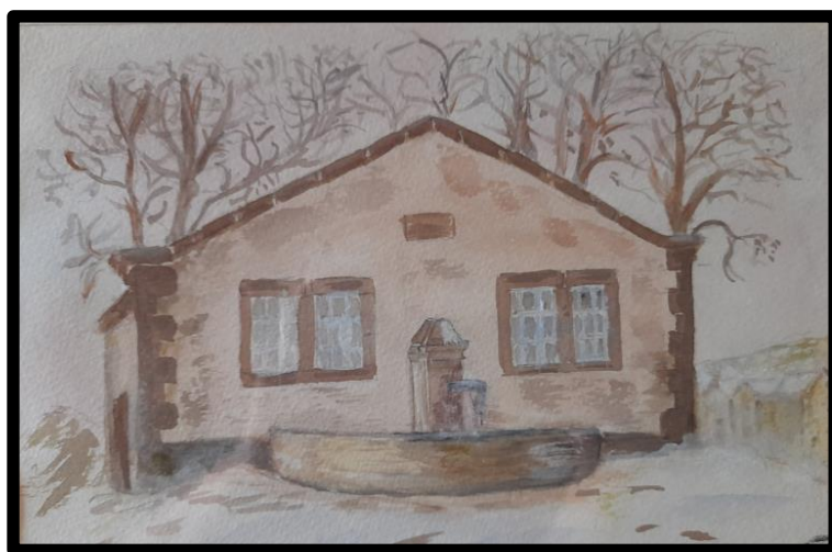
Lavoir de Flix-bas

Lorsque l'employé communal utilise l'épareuse pour débroussailler, nous recommandons aux passants de s'éloigner de la machine pour des raisons de sécurité.