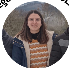
2 ème adjointe

"J'ai 34 ans, je suis mariée, j'ai 3 enfants et j'habite sur Fix depuis plus de 9 ans. Je suis secrétaire de mairie et ravie de m'investir pour un deuxième mandat au service de notre belle commune avec le souhait de continuer à redynamiser le village."