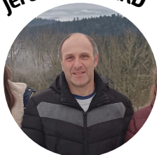
1 er adjoint

"J'ai 49 ans, je suis marié et j'ai deux enfants. Originaire de Fix. Je m'implique dans un deuxième mandat avec une nouvelle équipe afin de participer à la bonne gestion de la vie communale pour que Fix soit un village où il fait bon vivre ."