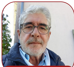
Le mot du Maire

Dans ce premier numéro du bulletin d'informations, vous constaterez que le format change; plus de couleur, plus de rubriques, plus de qualité dans le papier et la présentation. Cette « GAZETTE » est la raison d'être de notre engagement collectif pour ce nouveau mandat. Vous avez compris cet engagement et l'avez traduit très favorablement lors des élections du 15 mars dernier et je vous en remercie au nom de l'ensemble du nouveau conseil et en mon nom personnel.